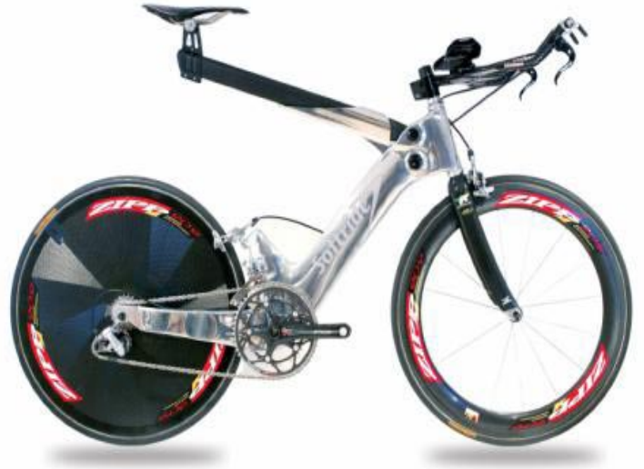
La softride, in una delle ultime versioni

I contributi più grossi che il triathlon ha dato al ciclismo in ambito tecnologico sono però l'introduzione dei cerchi aerodinamici ad alto profilo ed a basso numero di raggi e la spinta verso l'applicazione di nuovi materiali performanti come l'alluminio, il carbonio ed il titanio.